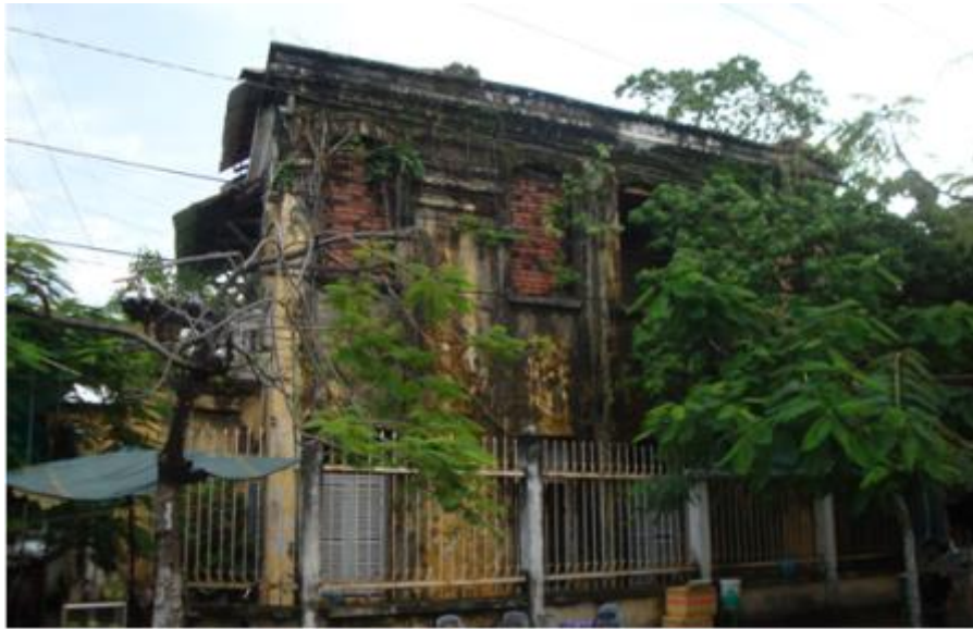
Trụ sở Tỉnh ủy lâm thời năm 1945.

Nhà Carrie xây dựng theo kiến trúc biệt thự phương Tây, với quy mô khá đồ sộ thời bấy giờ, phía trước có sân và hàng rào song sắt kiên cố. Nhà xây dựng một trệt một lầu, mái nhà lợp ngói Tây cổ kính, tường xây gạch vôi vữa trông vững trãi cùng với các chi tiết kiến trúc và các họa tiết hoa văn trang trí hài hòa tạo cho tổng thể kiến trúc ngôi nhà đầy vẻ cổ kính và sang trọng. Với những giá trị kiến trúc cổ, nhà Carrie được liệt vào danh sách 21 nhà cổ tiêu biểu của tỉnh và được UBND tỉnh Bạc Liêu xếp hạng là di tích lịch sử cấp tỉnh năm 2013.