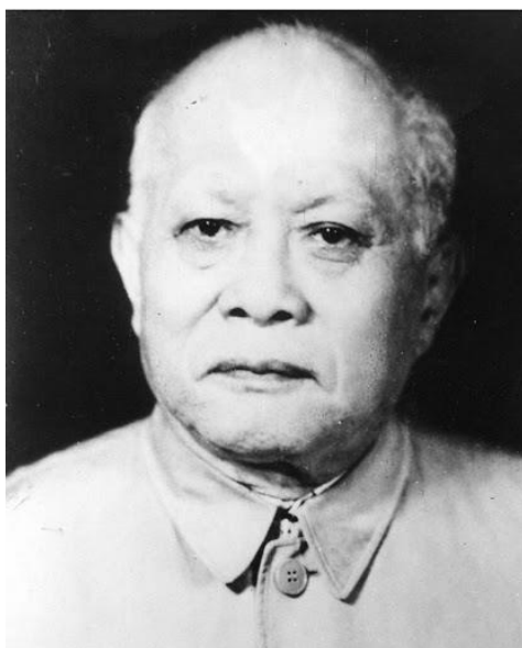
Đồng chí Tôn Đức Thắng

Đồng chí Tôn Đức Thắng, sinh ngày 20 tháng 8 năm 1888 trong một gia đình nông dân khá giả tại Cù lao Ông Hồ, làng Mỹ Hoà Hưng, Tổng Định Thành, tỉnh Long Xuyên (nay là xã Mỹ Hòa Hưng, thành phố Long Xuyên, tỉnh An Giang).