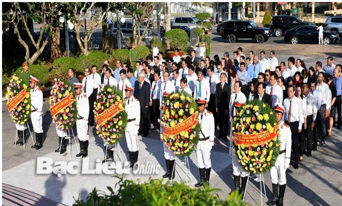
Lãnh đạo Trung ương và tỉnh viếng Đài tưởng niệm các anh hùng liệt sĩ tỉnh Bạc Liêu.

Ngày 23/8/1945 là cột mốc lịch sử quan trọng trong những trang sử vẻ vang của cách mạng Bạc Liêu - ngày của sự kiện giành lại chính quyền không đổ máu, không tiếng súng. Một chiến thắng anh hùng, mưu trí và cũng rất đổi nhân văn! Tự hào với cột mốc ấy, từ năm 2005, ngày 23/8 đã được Bạc Liêu chọn là ngày truyền thống cách mạng của tỉnh.