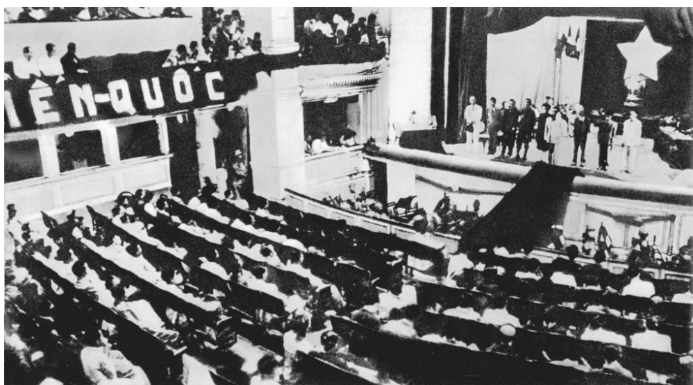
Kỳ họp thứ nhất, Quốc hội khóa I – Quốc hội đầu tiên của nước Việt Nam Dân chủ Cộng hòa sau Tổng tuyển cử ngày 6-1-1946, tại Nhà hát lớn Hà Nội.

Sự phát triển của Quốc hội là một quá trình liên tục kế thừa và không ngừng đổi mới, đáp ứng yêu cầu nhiệm vụ của mỗi giai đoạn cách mạng Việt Nam. Kinh nghiệm thực tiễn của Quốc hội khóa trước luôn là bài học quý cho việc củng cố, nâng cao Quốc hội khóa sau. Việc đổi mới cơ cấu tổ chức và phương thức hoạt động của Quốc hội được tiến hành chặt chẽ, đồng bộ, có định hướng mục tiêu rõ ràng, bước đi chắc chắn và mang lại hiệu quả thiết thực.