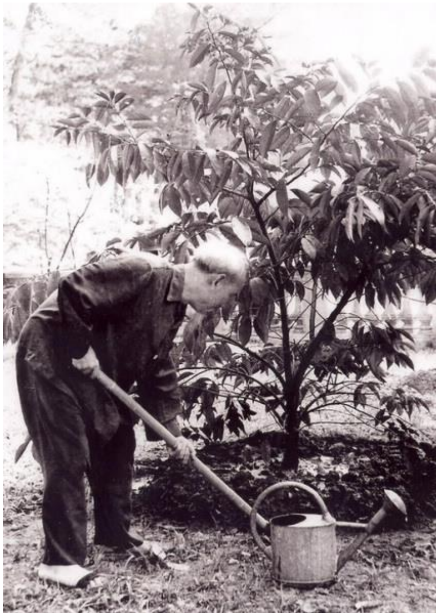
Bác Hồ chăm sóc cây vú sữa của đồng bào miền Nam gửi tặng Người

Cuộc kháng chiến chống Mỹ cứu nước trường kỳ và gian khổ, đồng bào miền Nam vẫn là người “ Đi trước về sau ”. Bác chúc mừng năm mới ngày 1/1/1956 và khen: “ Miền Nam yêu quý của chúng ta luôn xứng đáng là “Thành đồng Tổ quốc” ”. Các cán bộ tập kết đem theo cây vú sữa của đồng bào miền Nam gửi tới Chủ tịch Hồ Chí Minh, Bác trồng cây vú sữa ngay cạnh ngôi nhà ở góc vườn Phủ Chủ tịch. Khi chuyển về ở và làm việc tại nhà sàn, Người cho chuyển cây vú sữa về trồng cạnh nhà sàn để hàng ngày Bác chăm sóc và luôn cảm thấy gần đồng bào chiến sĩ miền Nam.