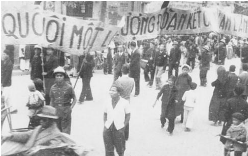
Nhân dân lao động Thủ đô cổ động cho ngày Tổng Tuyển cử đầu tiên.

Ngày 8-9-1945, Chính phủ lâm thời nước Việt Nam Dân chủ Cộng hoà ban hành Sắc lệnh số 14-SL quy định mở cuộc Tổng tuyển cử bầu Quốc hội Khóa I. Công tác chuẩn bị cho Tổng tuyển cử đầu tiên diễn ra rất khẩn trương trong điều kiện thù trong, giặc ngoài và kinh tế-xã hội đất nước còn hết sức khó khăn.