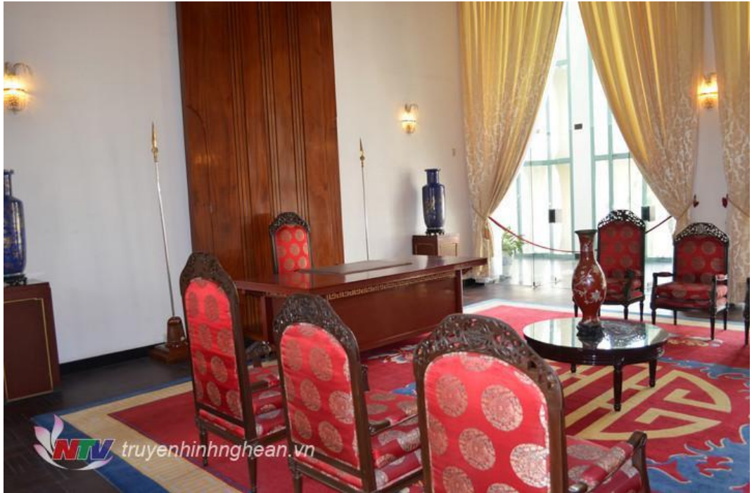
Phòng làm việc và tiếp khách của Tổng thống trong Dinh Độc Lập.