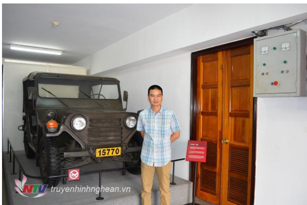
Phiên bản xe Jeep đưa TT Dương Văn Minh của chính quyền VNCH ra Đài phát thanh Sài Gòn tuyên bố đầu hàng Quân giải phóng vô điều kiện.