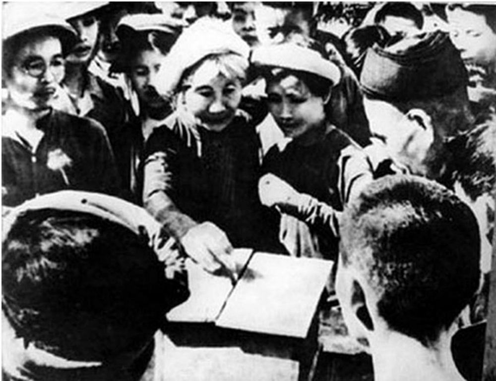
Cử tri ngoại thành Hà Nội bỏ phiếu bầu đại biểu Quốc hội khóa I ngày 6-1-1946.

thôn đến thành thị, không phân biệt gái trai, già trẻ đã dành trọn ngày lịch sử ngày 6-1-1946: Toàn dân đi bỏ phiếu bầu cử Quốc hội.