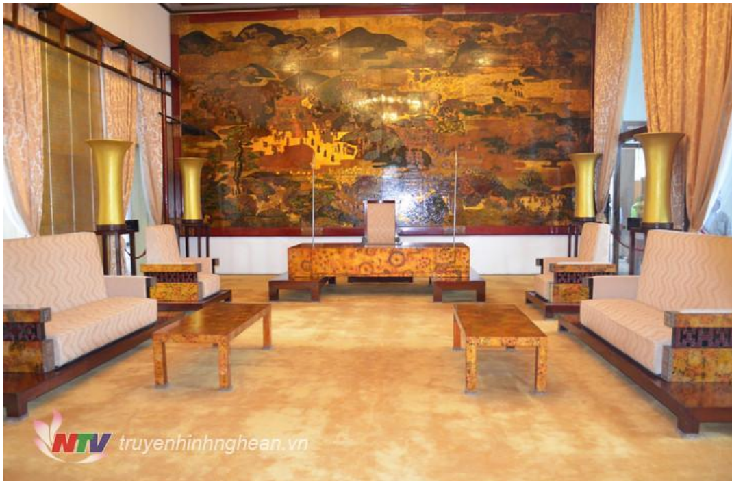
Phòng Trình quốc thư trong Dinh Độc Lập.