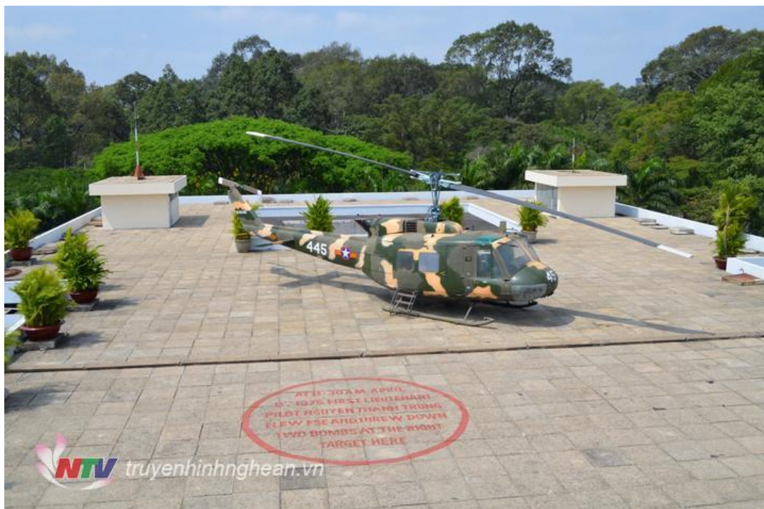
Sân đỗ máy bay trực thăng của Dinh Độc Lập