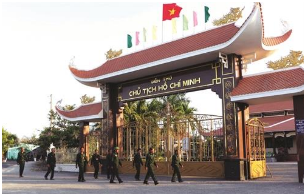
Đền thờ Bác Hồ ở xã Châu Thới thường xuyên mở cửa đón khách đến thăm viếng

Tọa lạc tại ấp Bà Chăng A, xã Châu Thới, huyện Vĩnh Lợi (Bạc Liêu), đền thờ Bác Hồ đã được Bộ Văn hóa - Thông tin (nay là Bộ Văn hóa, Thể thao và Du lịch) xếp hạng Di tích lịch sử cấp quốc gia vào năm 1998.