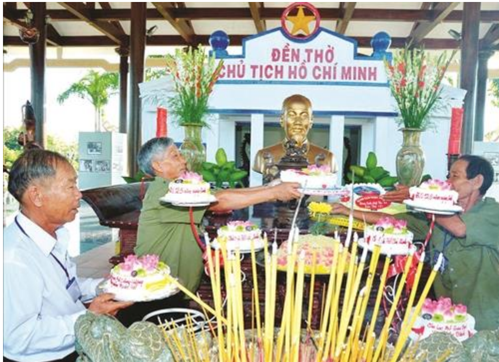
Hàng năm, tại đền thờ Bác Hồ, người dân địa phương tổ chức các hoạt động kỷ niệm nhân ngày sinh của Bác (19/5)