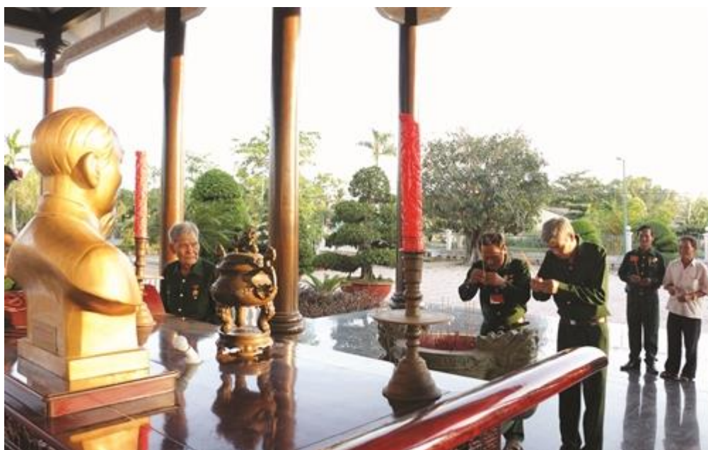
Người dân thành kính dâng hương lên Chủ tịch Hồ Chí Minh