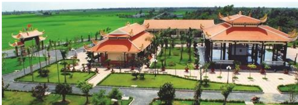
Toàn cảnh đền thờ Bác Hồ tại xã Châu Thới