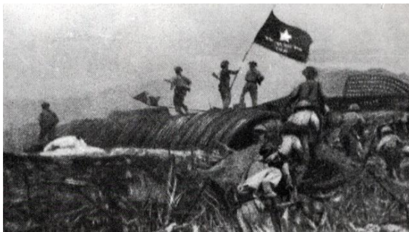
Chiến thắng Điện Biên Phủ 1954

69 năm đã trôi qua, Chiến dịch Điện Biên Phủ (07/5/1954 - 07/5/2023) là một chiến dịch điển hình trong lịch sử cuộc kháng chiến chống thực dân Pháp của quân và dân ta đánh thắng quân viễn chinh Pháp có tiềm lực quân sự mạnh, vũ khí trang bị hiện đại. Chiến dịch Điện Biên Phủ kết thúc với thắng lợi hoàn toàn thuộc về Nhân dân Việt Nam. Chiến thắng vĩ đại ở Điện Biên Phủ không những ghi vào lịch sử dân tộc Việt Nam như một mốc son rực sáng nhất trong thế kỷ XX, mà ý nghĩa và tầm vóc của sự kiện lịch sử trọng đại này không hề phai mờ, trái lại, những bài học lịch sử vẫn còn nguyên giá trị trong sự nghiệp xây dựng và bảo vệ Tổ quốc Việt Nam xã hội chủ nghĩa.