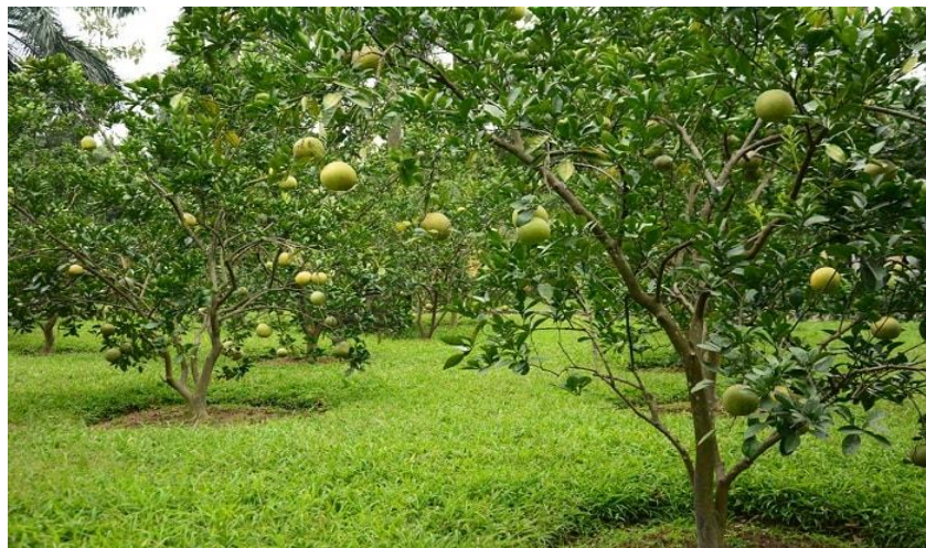
Khu vườn cây tại khu di tích Chủ tịch Hồ Chí Minh

Vườn cây xanh với diện tích hơn 65.000m 2 , kết hợp với ao cá tạo nên một bức tranh thiên nhiên hữu tình. Hệ sinh thái thực vật trong vườn rất phong phú, đa dạng. Các loài cây được trồng xen kẽ nhau tạo nên những nét chấm phá, làm tăng sự hấp dẫn sinh động của cảnh quan. Nhiều cây mang ý nghĩa lịch sử, văn hoá, gắn với quê hương đất nước, gắn với tình đồng chí, bè bạn quốc tế, tình hữu nghị giữa các dân tộc.