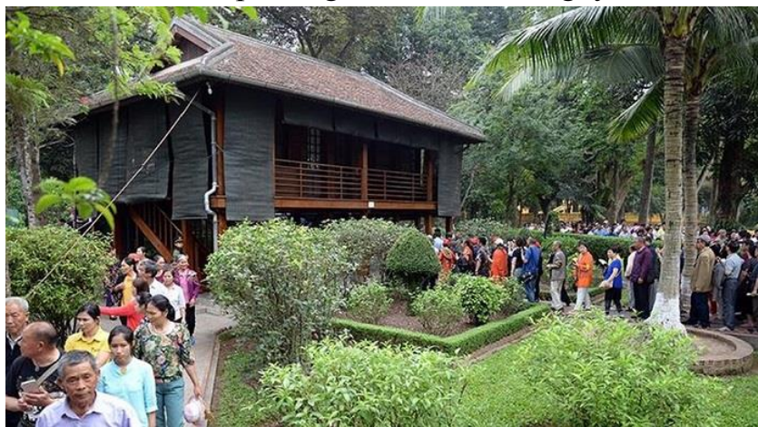
Nhà sàn Bác Hồ trong khuôn viên khu di tích chủ tịch Hồ Chí Minh

Nhà sàn gỗ tại khu di tích Chủ tịch Hồ Chí Minh là nơi Bác sống và làm việc từ giữa 5/1958 đến 1969. Đây là kiểu nhà sàn được chính Bác lựa chọn sau buổi gặp mặt đại biểu các dân tộc thiểu số Việt Bắc tại Phủ Chủ tịch và sau chuyến đi thăm một số địa phương của tỉnh Thái Nguyên.