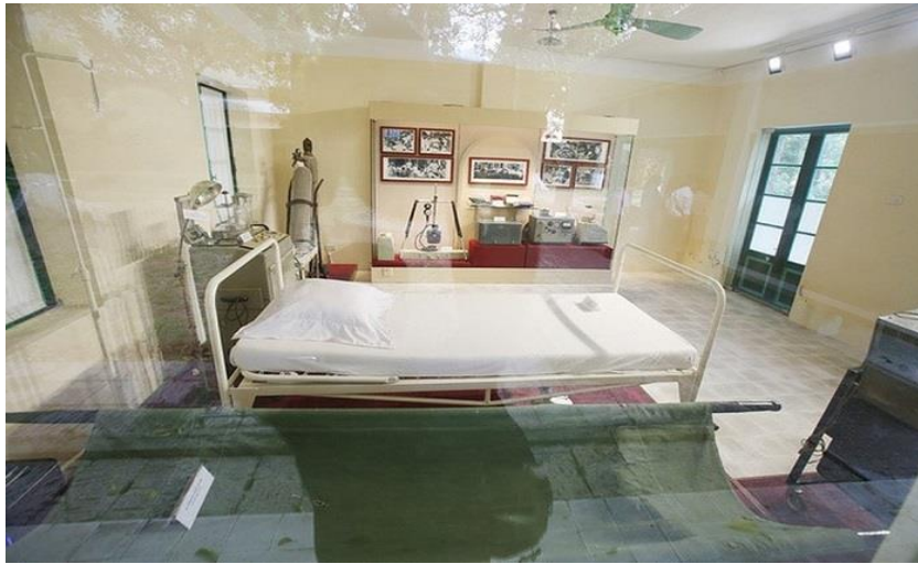
Đây là nơi lưu giữ khoảnh khắc cuối cùng của Bác Hồ

chiếc đài ZENITH trên bàn làm việc, đồng hồ trên tủ nhỏ ở cạnh giường và cuốn lịch treo tường dừng lại thời khắc Bác đi xa: 9 giờ 47 phút ngày 2/9/1969.