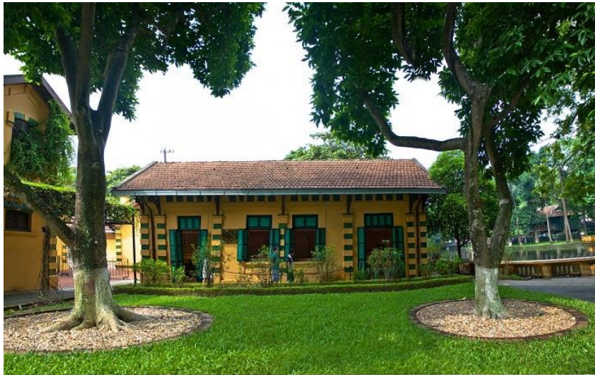
Khu vực nhà 54

Nhà 54 là nơi Bác Hồ sống và làm việc từ 12/1954 đến giữa 5/1958. Sau đó, Bác chuyển sang ở ngôi nhà sàn được xây dựng trong khu vườn Phủ Chủ tịch nhưng hàng ngày vẫn trở về đây để dùng cơm và khám sức khỏe định kỳ.