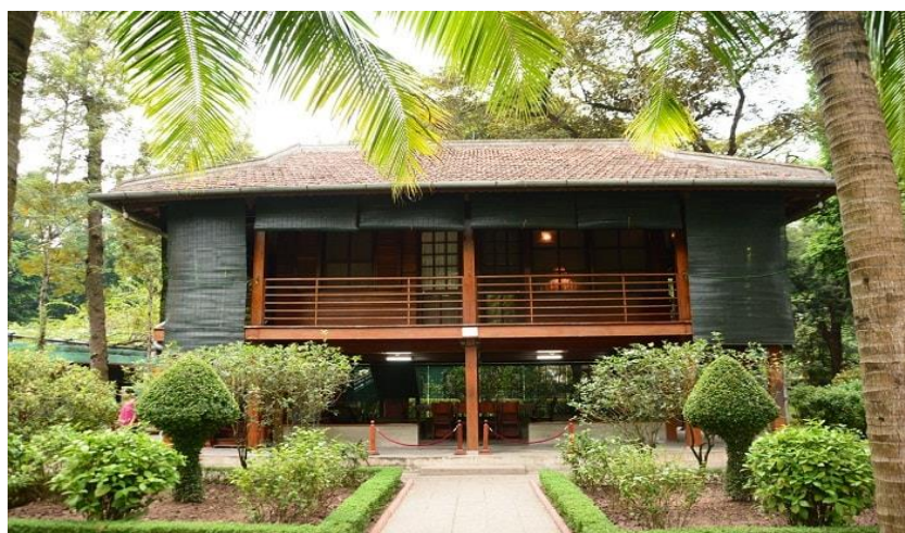
Cận cảnh nhà sàn Bác Hồ

Nhà gồm 2 tầng được làm bằng gỗ dổi, mái lợp ngói. Trước nhà là một vườn hoa nhỏ, trồng nhiều loại hoa thơm. Phía ngoài là hàng rào dâm bụt gợi nhớ hình ảnh ngôi nhà Bác đã sinh ra và lớn lên ở quê hương Nghệ An . Tầng dưới là nơi Bác sinh hoạt, tiếp khách. Tầng bên trên có hai phòng là phòng làm việc và phòng ngủ. Hiện nay gần 250 tài liệu, hiện vật thuộc nhiều chất liệu khác nhau ở nhà sàn vẫn được giữ nguyên vẹn và bảo quản chu đáo như những ngày cuối cùng Bác sống và làm việc.