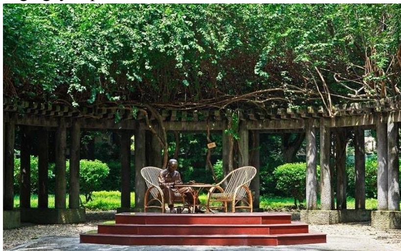
Khu vực hoa giấy nơi Bác thường hay tiếp khách

Trong vườn cây xanh có một khoảng đất trải sỏi nằm cạnh đường Xoài được gọi là giàn hoa Phủ Chủ tịch bởi bao quanh khoảng đất là giàn hoa giấy màu tím. Bác coi giàn hoa này như một phòng khách đặc biệt, không bị giới hạn bởi không gian nên thường tiếp khách trong nước, ngoài nước thân tình tại đây vào những ngày đẹp trời.