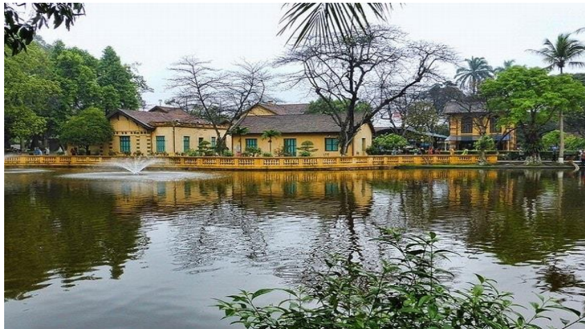
Khu nhà bác ở tại khu di tích Phủ chủ tịch