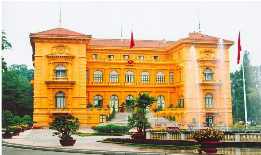
Phủ Chủ tịch nằm trong khuôn viên khu di tích Chủ tịch Hồ Chí Minh

Khu di tích Chủ tịch Hồ Chí Minh tại Phủ Chủ tịch được gọi tắt là Khu di tích Phủ Chủ tịch tại Hà Nội, là nơi sống và làm việc lâu nhất của Hồ Chí Minh (từ 19 tháng 12 năm 1954 đến 2 tháng 9 năm 1969), được Bộ Văn hóa Thông tin ra Quyết định xếp hạng là Khu di tích ngày 15 tháng 5 năm 1975. Hiện nay, nơi đây đã được thủ tướng chính phủ Việt Nam đưa vào danh sách xếp hạng 23 di tích quốc gia đặc biệt.