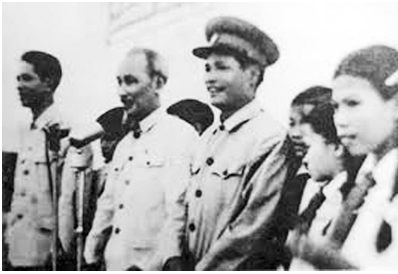
Bác Hồ về thăm Quảng Bình, ngày 16/6/1957

Từ ngày 6/1 đến ngày 7/2/1930 tại Cửu Long (Hương Cảng, Trung Quốc), Nguyễn Ái Quốc chủ trì Hội nghị hợp nhất các tổ chức cộng sản, thành lập Đảng Cộng sản Việt Nam.