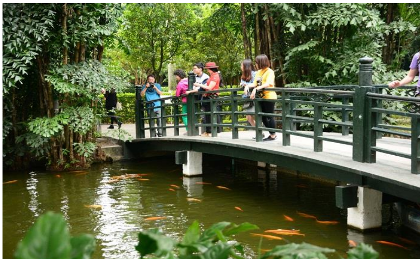
Ao cá nằm ngay trước nhà sàn của Bác

Ao cá trong khu di tích Chủ tịch Hồ Chí Minh rộng hơn 3.000m 2 nằm phía trước nhà sàn. Trong ao nuôi nhiều loại cá khác nhau như: trắm, chép, mè, rô phi... Hàng ngày, sau giờ làm việc buổi chiều, Bác thường ra cầu ao cho cá ăn. Trước khi cho cá ăn, Bác thường vỗ tay gọi, lâu dần tiếng vỗ tay đã tạo cho cá một phản xạ quen thuộc, hễ cứ nghe tiếng vỗ tay cá lại bơi về cầu ao.