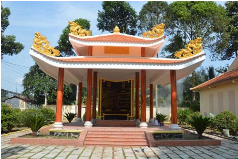
Bia ghi dấu ấn địa điểm xét xử đầu tiên ở Nam bộ được xây dựng trong khuôn viên Di tích lịch sử Nam Kỳ khởi nghĩa (Khu Di tích lịch sử cấp Quốc gia Đình Long Hưng)

Đây cũng là nơi được Tỉnh ủy Mỹ Tho chọn làm trụ sở của Ủy ban Khởi nghĩa tỉnh Mỹ Tho. Tại đây, lần đầu tiên trên cả nước, lá Cờ đỏ sao vàng tung bay trên ngọn cây bàng, đây cũng là địa điểm ra đời của Ủy ban nhân dân cách mạng lâm thời tỉnh Mỹ Tho.