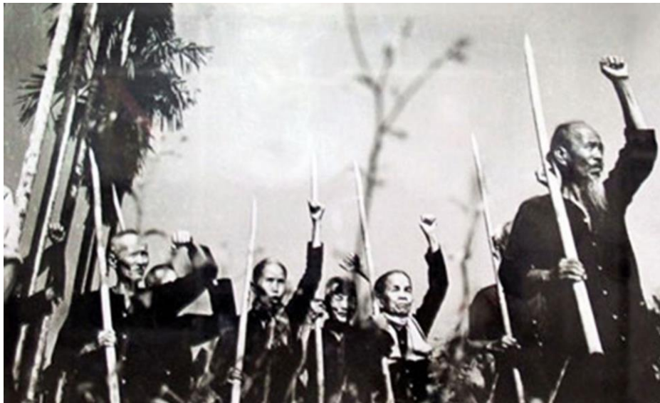
Ảnh tư liệu