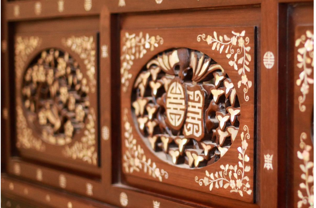
Tất cả đồ vật trong nhà đều được trang trí hoa văn, chạm trổ tinh tế.