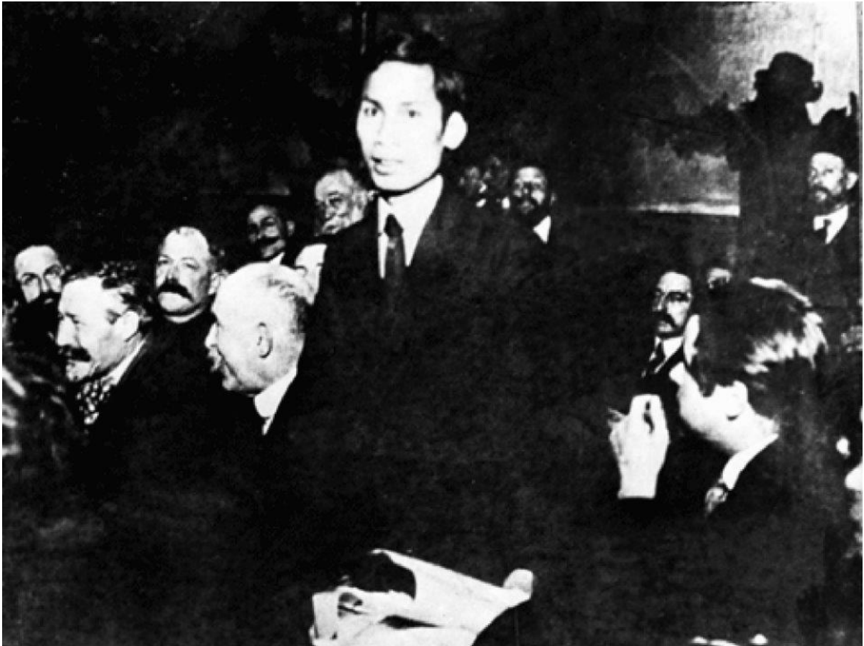
Bác Hồ tại Đại hội Tours năm 1920

Cách đây 109 năm, ngày 5/6/1911, người thanh niên yêu nước Nguyễn Tất Thành với ý chí mãnh liệt, lòng yêu thương dân tộc sâu sắc đã quyết tâm ra đi thực hiện hoài bão giải phóng nước nhà khỏi ách nô lệ của thực dân, đế quốc.