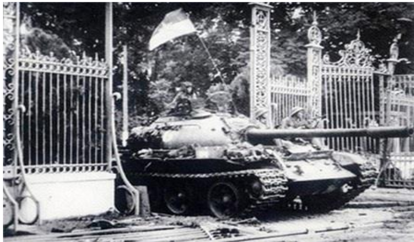
Đúng 11 giờ 30 phút ngày 30/4/1975, xe tăng của quân Giải phóng đã tiến vào dinh Tổng thống, sào huyệt cuối cùng của chế độ Ngụy quyền Sài Gòn, giải phóng miền Nam, thống nhất hoàn toàn đất nước (Ảnh: sưu tầm)

Chiến thắng ngày 30/4/1975 là thành quả vĩ đại trong sự nghiệp giải phóng dân tộc, giải phóng xã hội do Đảng ta và chủ tịch Hồ Chí Minh lãnh đạo; là trang sử hào hùng, chói lọi trên con đường dựng nước và giữ nước hàng ngàn năm lịch sử của dân tộc. Quân và dân ta đã đánh thắng kẻ thù lớn mạnh và hung hãn nhất của loài người tiến bộ; kết thúc oanh liệt cuộc chiến đấu 30 năm giành độc lập tự do, thống nhất cho Tổ quốc; chấm dứt ách thống trị hơn một thế kỷ của chủ nghĩa thực dân cũ và mới trên đất nước ta; là thắng lợi tiêu biểu của lực lượng cách mạng thế giới, góp phần thúc đẩy cuộc đấu tranh của nhân dân thế giới vì mục tiêu độc lập dân tộc, hòa bình, dân chủ và tiến bộ xã hội; cổ vũ động viên các dân tộc đang tiến hành công cuộc giải phóng dân tộc, chống chủ nghĩa thực dân kiểu mới trên toàn thế giới.