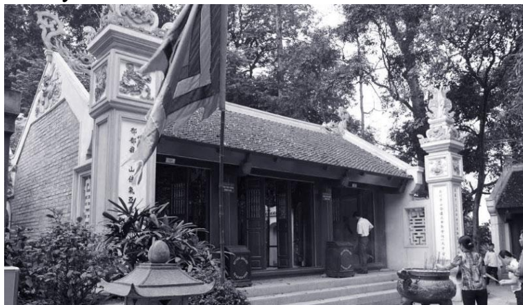
Đền Trung (Hùng Vương tổ miếu)

Đền Trung tương truyền xưa kia Vua Hùng bàn việc nước và ngắm cảnh thiên nhiên, núi sông cùng các Lạc tướng, Lạc Hầu. Đây cũng là nơi vị vua Hùng thứ 6 nhường ngôi cho Lang Liêu vì làm ra 2 loại bánh ý nghĩa: bánh chưng, bánh dày.