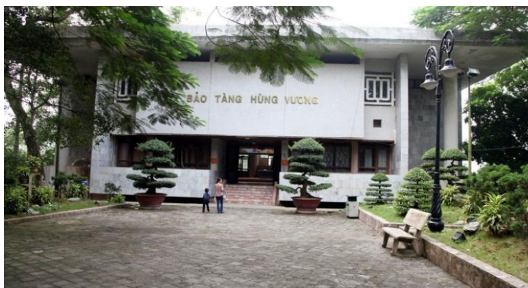
Bảo tàng Hùng Vương

Việc xây dựng Bảo tàng Hùng Vương bắt đầu vào năm 1996 và hoàn thành vào ngày khai mạc Lễ hội Đền Hùng năm 2003. Có hơn 4000 di vật văn hóa trong bảo tàng, gần 700 di vật văn hóa gốc, 162 bức ảnh, 4 bức tranh gốm sứ, 5 bức tranh được trưng bày bằng sơn mài, 9 chiếc gò đồng, 5 chiếc hộp đựng ảnh, một bộ tượng lớn và nhiều bức khác. Tất cả các hiện vật mô tả một chủ đề bao quát: “ Các Vua Hùng dựng nước Văn Lang trên mảnh đất Phong Châu lịch sử ”.