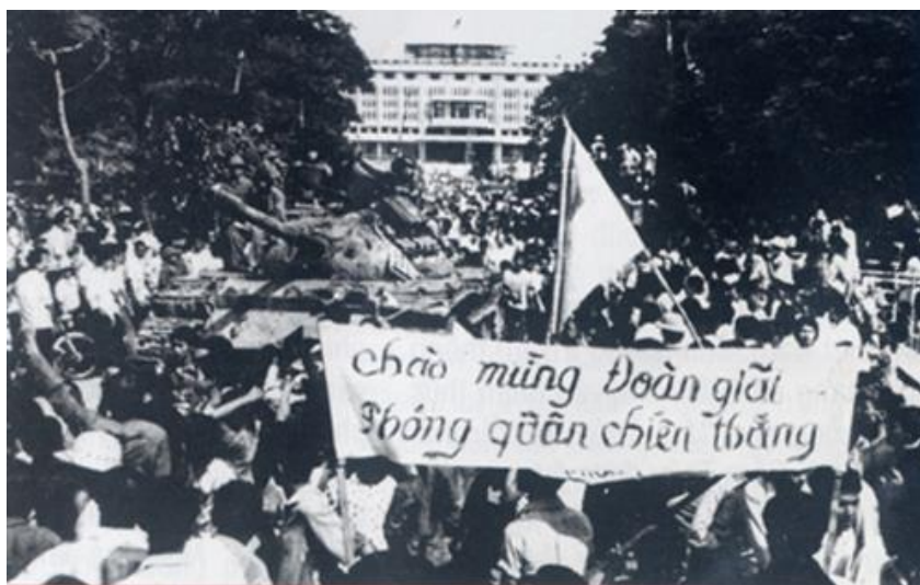
Khu vực dinh độc lập ngày 30/4/1975

Vào lúc 17 giờ ngày 26/4, quân ta đã nổ súng mở đầu chiến dịch, năm cánh quân của ta đã vượt qua tuyến phòng thủ của địch để tiến vào trung tâm Sài Gòn, đánh chiếm các cơ quan đầu não của chúng. 10 giờ 45 phút ngày 30/4, xe tăng và bộ binh của ta tiến vào Dinh Độc Lập, bắt toàn bộ Nội các của Sài Gòn, Dương Văn Minh vừa lên chức tổng thống ngày 28/4 đã phải tuyên bố đầu hàng quân ta không điều kiện. 11 giờ 30 phút ngày 30/4/1975 bỗng tiếng loa phát thanh từ đài công cộng vang lên bản tin hùng hồn của Đài Phát thanh Tiếng nói Việt Nam thông báo: “Sài Gòn đã hoàn toàn giải phóng”.