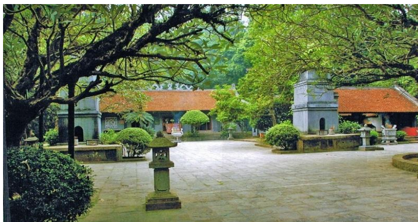
Chùa Thiên Quang

Chùa Thiên Quang tên cổ là Sơn cảnh thừa long tự. Chùa xây theo kiểu kiến trúc nội công ngoại quốc gồm 2 gian thiêu hương, 5 gian tiền đường, 3 gian tam bảo và nhà Tổ. Mái chùa lợp ngói mũi, các tòa theo kiểu cột trụ.