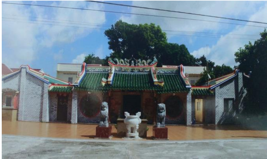
Huyền Thiên Thượng Đế Cổ Miếu

nhằm phổ cập tiểu học song ngữ Hoa - Việt miễn phí cho con em người Hoa trong vùng, nhưng đến năm 1980 do kinh phí không đáp ứng nên phải đóng cửa.