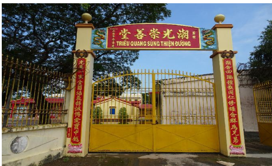
Cổng vào Triều Quang Sùng Thiện Đường

Di tích kiến trúc nghệ thuật Triều Quang Sùng Thiện Đường tọa lạc tại Khóm 10, Phường 1, Thành phố Bạc Liêu. Đây là một cơ sở tín ngưỡng dân gian của người Hoa Triều Châu được hình thành khá lâu đời vào khoảng năm 1927 ở Bạc Liêu. Được xây dựng theo hình chữ Quốc kiến trúc truyền thống đặc sắc của các đình miếu người Hoa. Ngoài những giá trị về kiến trúc nghệ thuật, đây còn là nơi bảo lưu nét tín ngưỡng dân gian, văn hóa tâm linh và mang nhiều giá trị nhân văn sâu sắc, là nơi an nghỉ cuối cùng của đa số người Hoa tại thành phố Bạc Liêu.