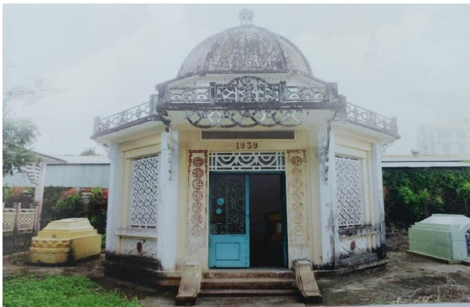
Nhà bao che mộ Chung Bá