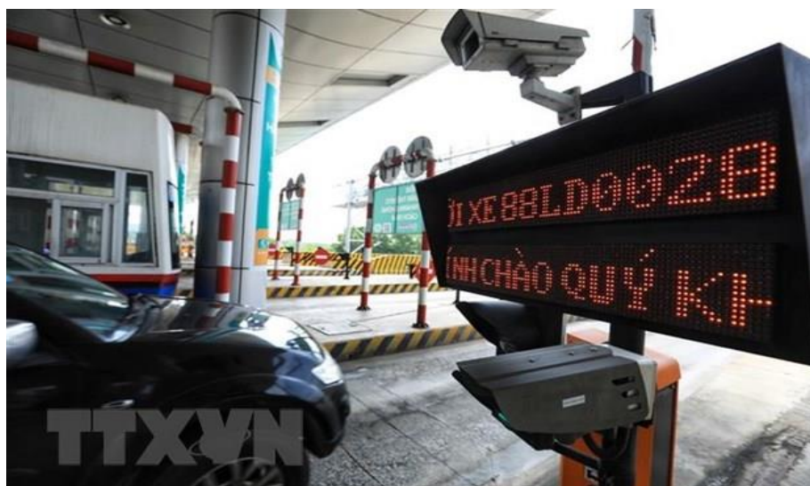
Thu phí tự động không dừng tại tuyến đường cao tốc Hà Nội-Hải Phòng.

Để đẩy nhanh tiến độ dán thẻ định danh đối với phương tiện xe ô tô, nhằm phát huy tối đa hiệu quả hệ thống thu phí ETC theo đúng yêu cầu của Quốc hội tại Nghị quyết số 62/2022/QH15 ngày 16/6/2022, góp phần giảm ùn tắc giao thông và minh bạch trong hoạt động thu phí, tiến tới xóa bỏ hình thức thu phí một dừng (sử dụng tiền mặt), Thủ tướng Chính phủ yêu cầu các Bộ trưởng, Thủ trưởng cơ quan ngang bộ, Thủ trưởng cơ quan thuộc Chính phủ, Chủ tịch Ủy ban nhân dân các tỉnh, thành phố trực thuộc trung ương; đề nghị người đứng đầu các cơ quan và tổ chức đoàn thể chính trị-xã hội ở trung ương và địa phương tiếp tục chỉ đạo dán thẻ định danh đối với toàn bộ phương tiện xe ô tô thuộc phạm vi quản lý của cơ quan, đơn vị (kể cả đối với các đơn vị trực thuộc) theo chỉ đạo của Thủ tướng Chính phủ tại Công điện số 155/CD-TTg ngày 22/02/2022. Thủ tướng Chính phủ yêu cầu không sử dụng hình thức thu phí một dừng (dùng tiền mặt) kể từ ngày 1/8/2022.