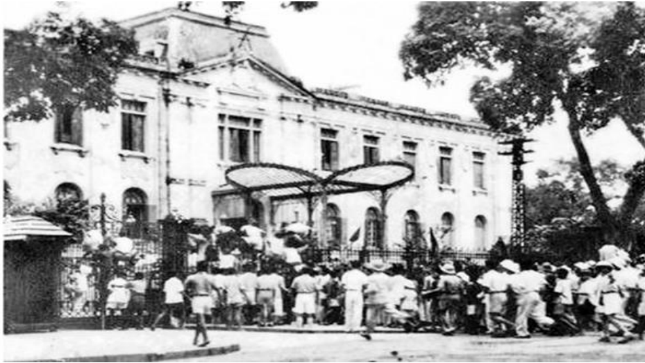
Quần chúng cách mạng và tự vệ chiến đấu Hà Nội chiếm Phủ Khâm sai (Bắc Bộ phủ), ngày 19/8/1945

Thắng lợi của Cách mạng Tháng Tám khẳng định trong điều kiện trào lưu của cách mạng vô sản, cuộc cách mạng do một Đảng của giai cấp công nhân lãnh đạo không chỉ có thể thành công ở một nước tư bản phát triển, mà còn có thể thành công ở một nước thuộc địa nửa phong kiến lạc hậu và đi lên theo con đường của chủ nghĩa xã hội. Đây là sự phát triển, vận dụng đầy sáng tạo lý luận Mác-Lênin vào điều kiện cụ thể của nước ta.