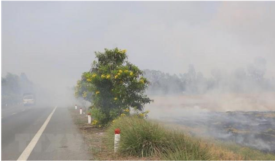
Khói đốt rơm làm hạn chế tầm nhìn trên Quốc lộ 61C, đoạn qua huyện Vị Thủy, tỉnh Hậu Giang.

Phạt tiền từ 50-70 triệu đồng đối với hành vi sử dụng thuốc bảo vệ thực vật, thuốc thú y, hóa chất đã hết hạn sử dụng hoặc ngoài danh mục cho phép và gây ô nhiễm môi trường.